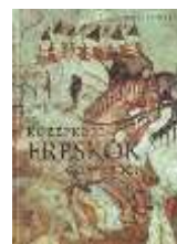
Középkori freskók Gömörben

Jó egészséget kíván Könyvtárunk minden virtuális látogatójának a GFE TK Könyvtárosa!