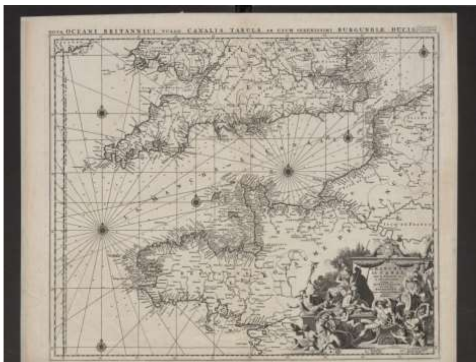
La Manche közlekedési térkép 1695

„Célunk sokrétű gyűjteményünk közkinccsé tétele a lehető legszélesebb körben, kiemelt figyelemmel a középiskolai és a felsőfokú oktatásban részt vevők, valamint a kutatók igényeire.”