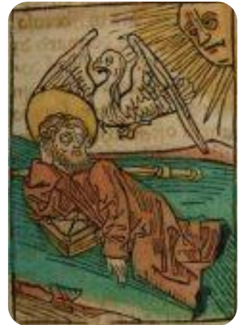
Szerváciusz püspök (Legenda Aurea Sanctorum, 1482. Augsburg)

E napokhoz időjóslatok is kapcsolódtak: például Nagydobronyban úgy tartották, ha fagyosszentekkor nagy a hideg, akkor rossz termés várható. Több vidéken is azt tartották, hogy ha az időjárás felhőtlen, akkor jó bortermés várható.