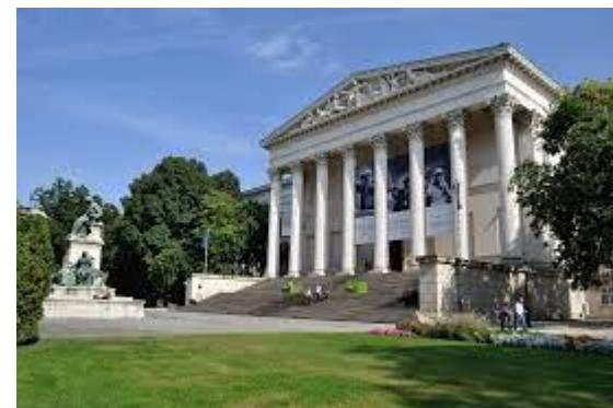
Magyar Nemzeti Múzeum