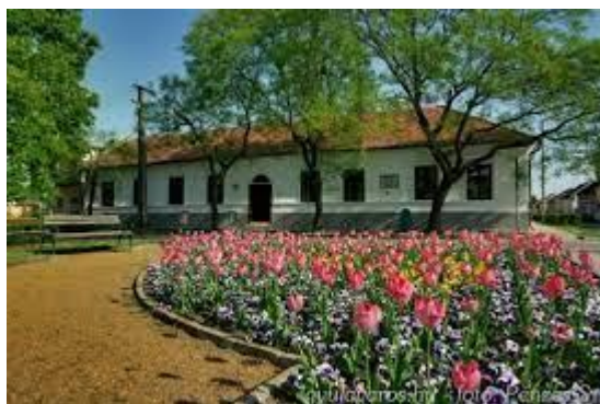
Erkel Ferenc Emlékház