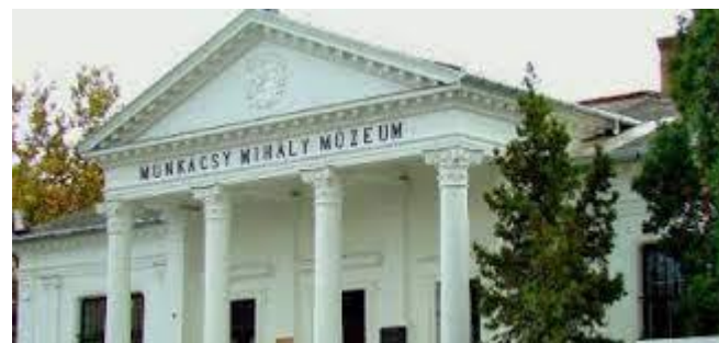
Munkácsy Mihály Múzeum