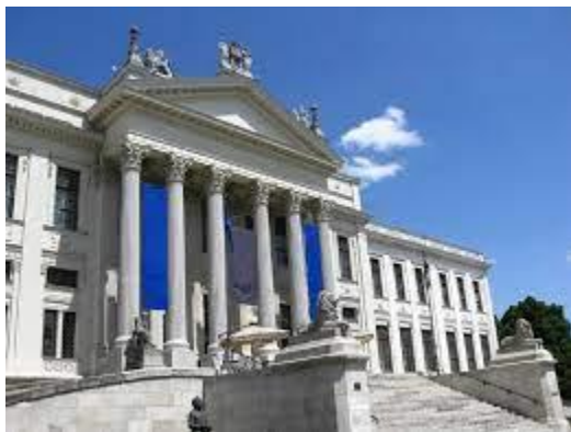
Móra Ferenc Múzeum

A múzeum az emberiség kultúrfejlődésére vonatkozó tárgyi és egyéb emlékeket gyűjtő, feldolgozó, rendszerező és másoknak bemutató kulturális intézmény. A múzeum ma már nem egyszerűen kiállítást jelent, hanem egyrészt számos kulturális rendezvénynek is otthont ad, másrészt a látogatót nem csupán passzív szemlélődésre, hanem modern technikai eszközök igénybevételével interaktív közreműködésre készíti. A „ne nyúlj hozzá!”; és a „mindent a szemnek”; jelszavak számos helyen ma már nem érvényesülnek – a látogató maga is részévé válik a kiállításnak.