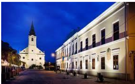
Tessedik Sámuel Múzeum