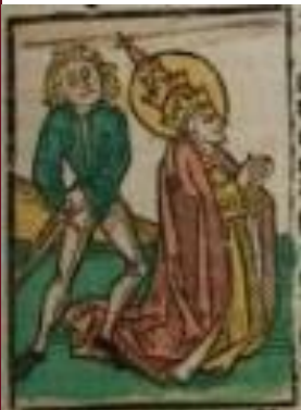
Illusztráció a Pannonhalmán őrzött Legenda Aurea Sanctorum című ősnyomtatvány 1482-es augsburgi kiadásából

Az Orbán (Urbanus) jelentése: ‚finom viselkedés’ (urbanitas), vagy az ur, azaz ‚világosság’ vagy ‚tűz’ és a banal, azaz ‚válasz’ szavak összetétele. Világosság volt tisztas életvitelében, tűz volt lángoló szeretetében, válasz volt tanítása mélységében. Világosság volt vagy fény, mivel a fény kellemes a ránézésben, szellemi a lényegében, égi a helyzetében, hasznos a tevékenységében. Így ez a szent szeretetre méltó volt életvitelében, szellemi a világ megvetésében, égi a szemlélődésben és hasznos a hit hirdetésében. A fagyosságok utolsója, a szőlőművelők és a velük közös érdekű kádások és kocsmárosok félve tisztelt patrónusa, egyike a népies kalendárium főalakjainak minálunk is. De míg hazánkban csak egy-két közmondás és szólásmód, meg a napjához fűződő néphit ápolja a hírnevét, addig Németország közepe táján és Németalföldön valóságos kultusz tárgya volt egészen a legújabb időkig.