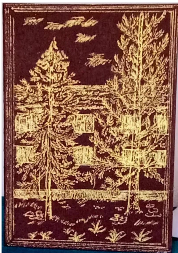
Hornyik Klára rajza.